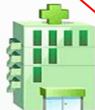
深圳市医保定点医院